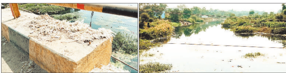
मनियारी नदी पर पसरी गंदगी, नदी किनारे फेंके गए मुर्गी के पंख।