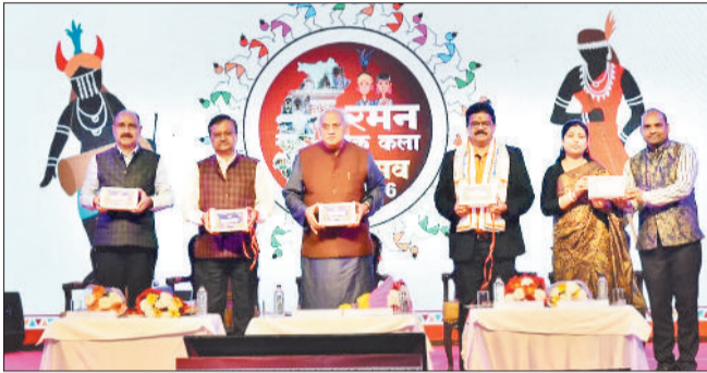
कार्यक्रम में उपस्थित अतिथि।