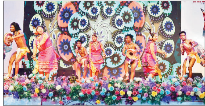
नृत्य की प्रस्तुति देते कलाकार।