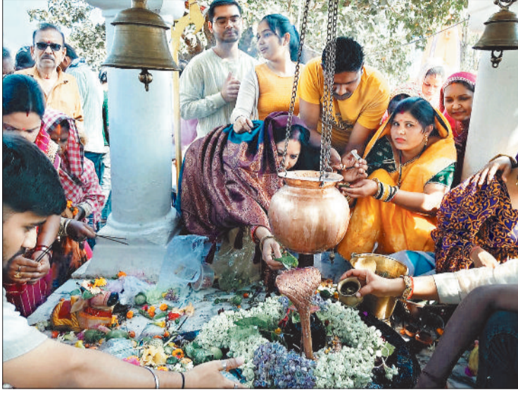
शिवालय में पूजा अर्चना करते श्रद्धालुजन।

महाशिवरात्रि पर्व पर नगर सहित ग्रामीण अंचलों में श्रद्धा, आस्था और उत्साह का अद्भुत संगम देखने को मिला। सुबह से ही शिवालयों में श्रद्धालुओं की भीड़ उमड़ पड़ी। खेमगीर बाबा मल्हापारा, खर्रांघाट स्थित गणेश महादेव मंदिर सहित नगर और आसपास के गांवों के शिव मंदिरों में भक्तों ने विधि-विधान से पूजा-अर्चना की। श्रद्धालु हाथों में बेलपत्र, फूल और पूजा सामग्री लिए लंबी कतारों में खड़े नजर आए। महाशिवरात्रि के अवसर पर रविवार को सुबह से ही क्षेत्र के शिवालयों में श्रद्धालुओं का तांता लगना प्रारंभ हो गया था। भोलेनाथ के दर्शन के लिए हाथों में पूजन सामग्री लेकर लोग घंटों लाईन में लगकर प्रतीक्षा भी करते रहे। शिवलिंग पर दूध, बेलपत्र, धतूरे से अभिषेक किया गया। शिव आराधना में महाशिवरात्रि का दिवस धार्मिक मान्यता के